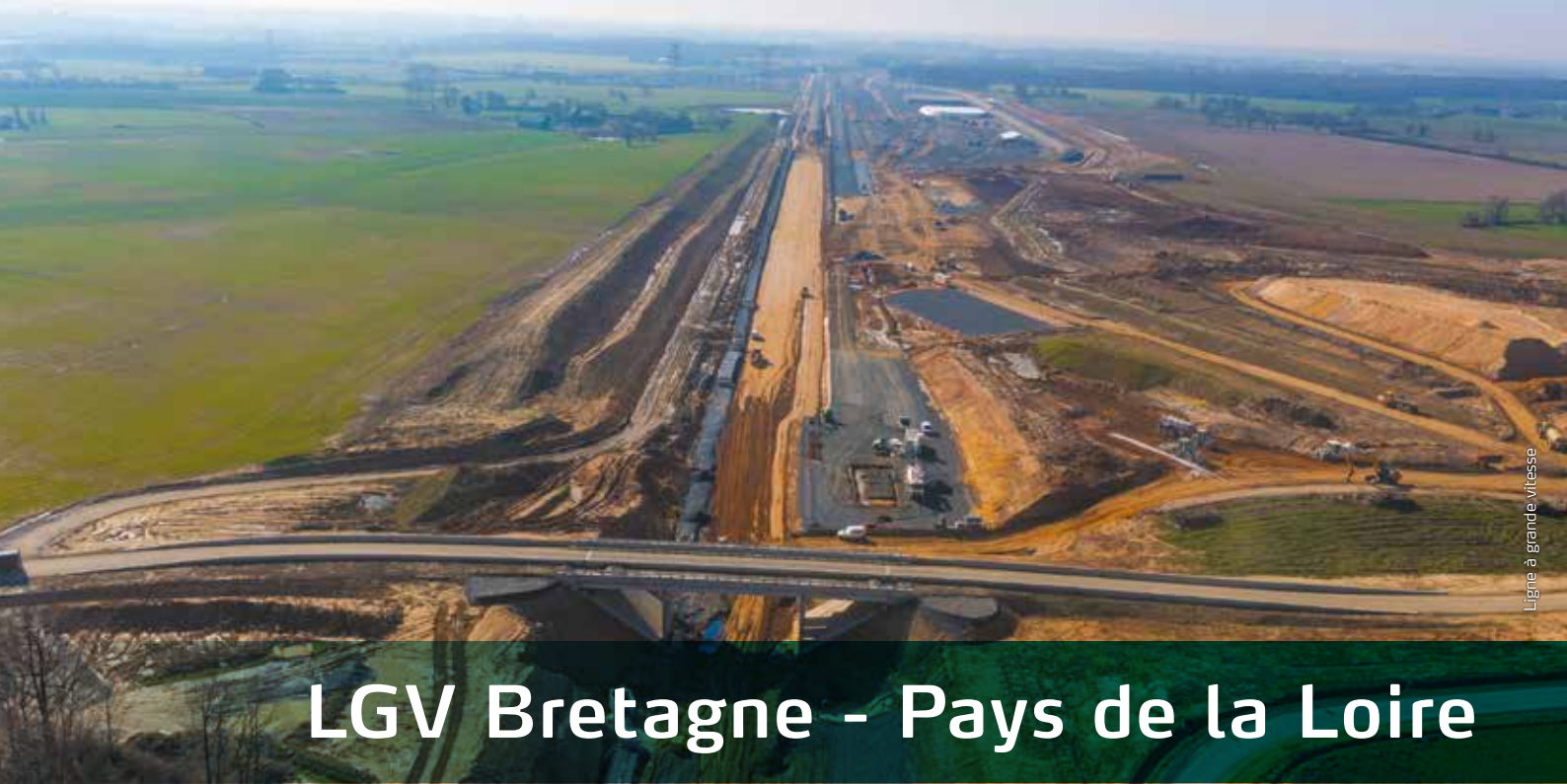
Ligne à grande vitesse