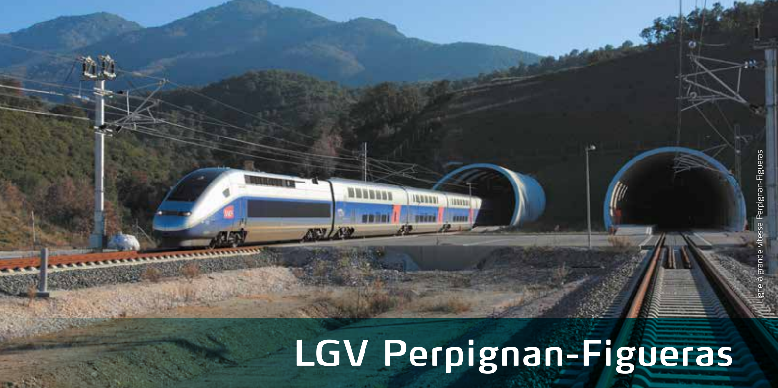
Ligne à grande vitesse Perpignan-Figueras