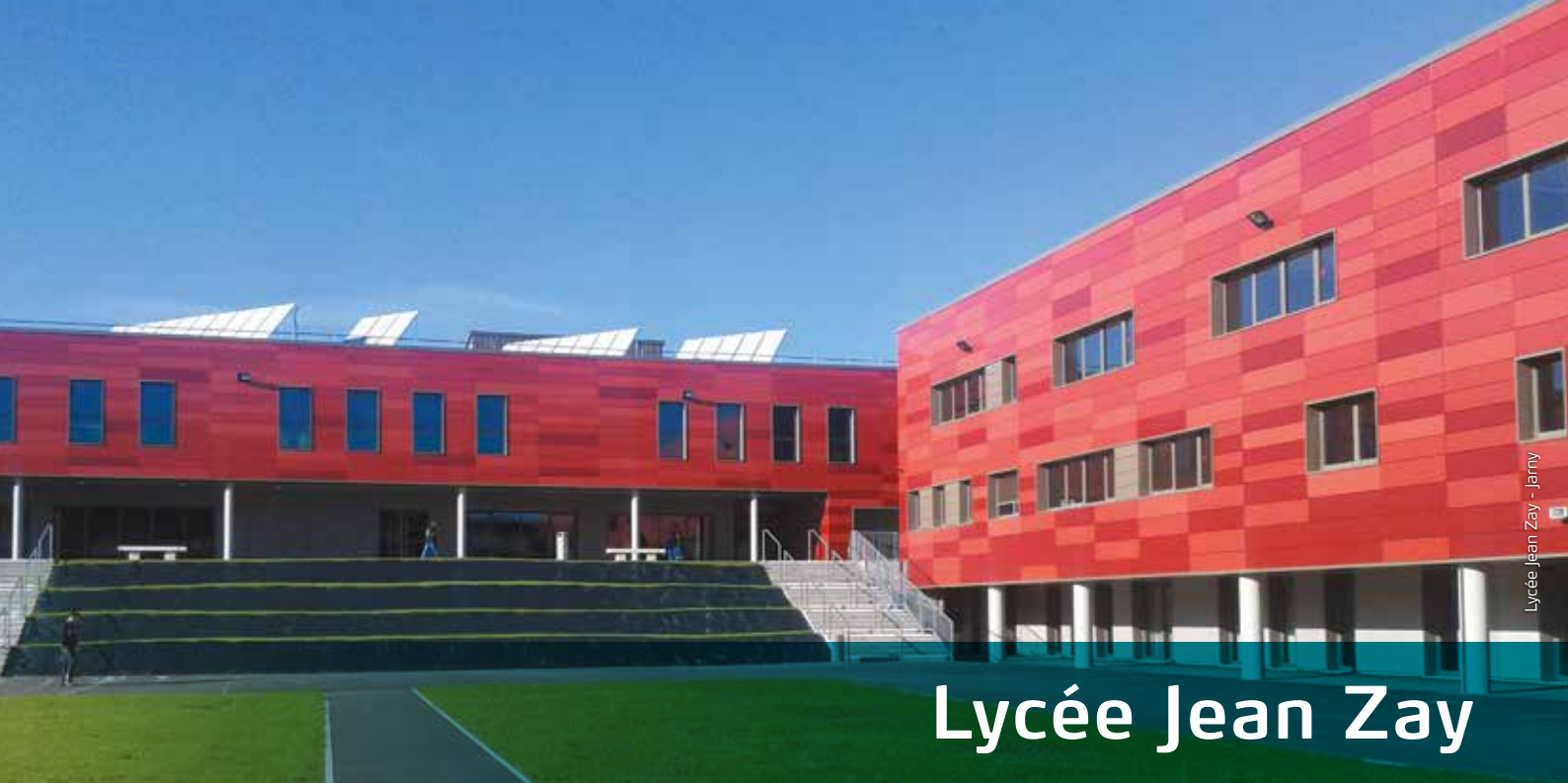
Lycée Jean Zay - Jarny